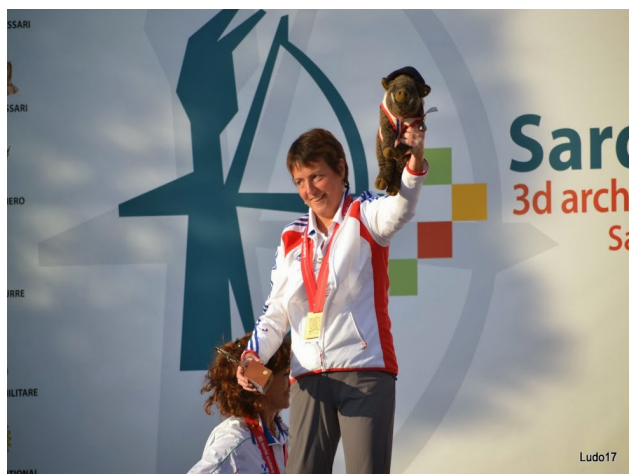
Sophie Cluze, Championne du Monde Arc Droit