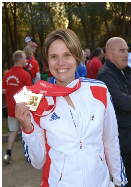
Déborah Courpron, Championne du Monde Arc libre